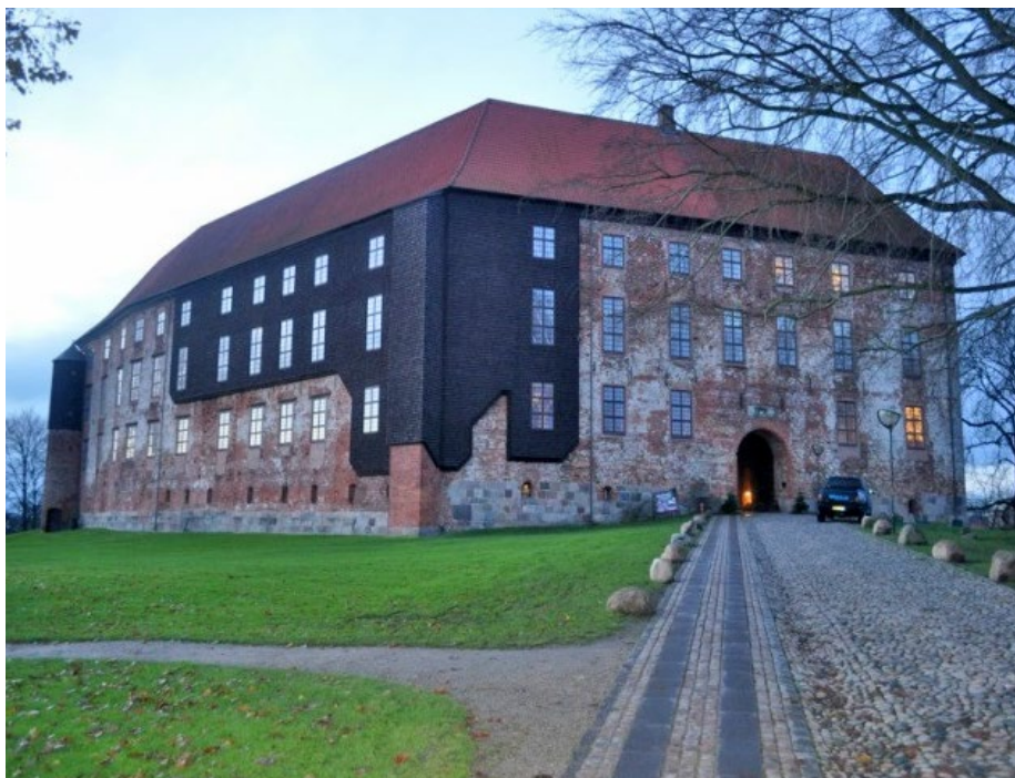
Restaureringen af Koldinghus er tildelt EUROPA NOSTRA-prisen