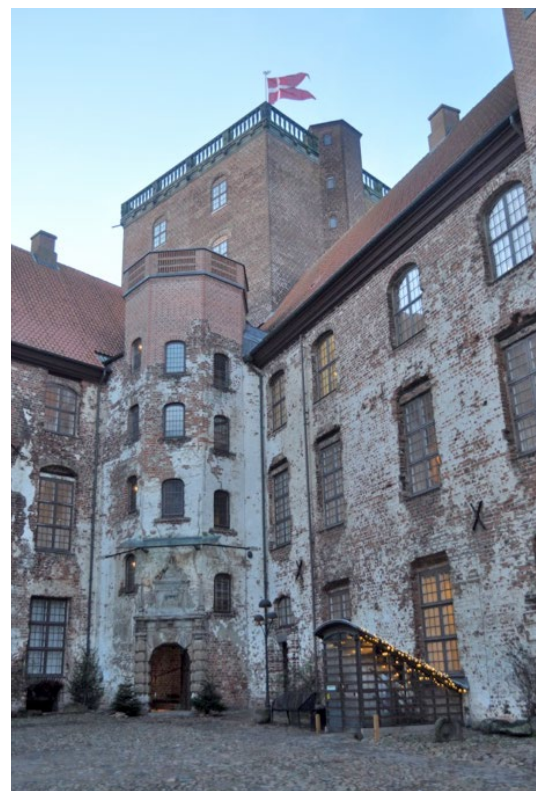
Der er monteret ACO DRAIN Multiline V150G øverst i det 35 meter høje udsigtstårn.