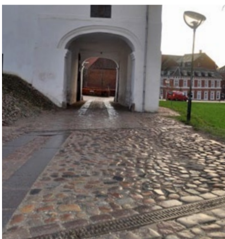
ACO DRAIN S100K monteret ved indkørsel til Slotspladsen.