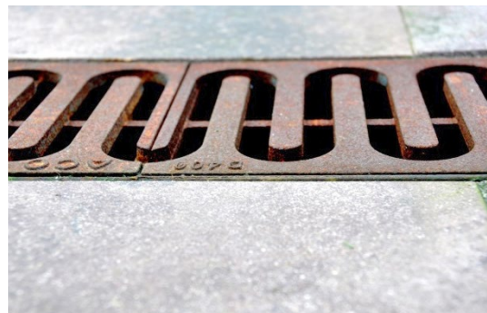
Linjedræn type ACO DRAIN Multiline V150G, monteret med designrist type "Løbende hun" i støbejern.