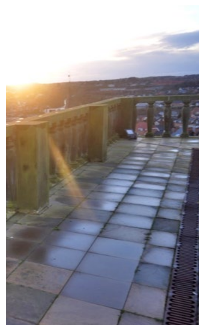
ACO's produkter er integreret så de passer sammen arkitektonisk.

I tæt samarbejde mellem Alectia A/S, Kjaer & Ricther A/S og ACO fandt vi frem til den optimale løsning. I videre samarbejde med de udførende parter, hvor Bækman VVS og O. Adsbøll & Sønner A/S stod for installationen, er det en fornøjelse i dag at kunne stå i toppen af Koldinghus Kæmpetårn, og fryde sig over den flotte restaurering med respekt for historien.