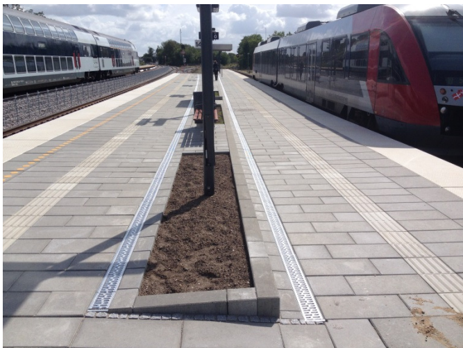
ACO DRAIN® V100S monteret i centerperron