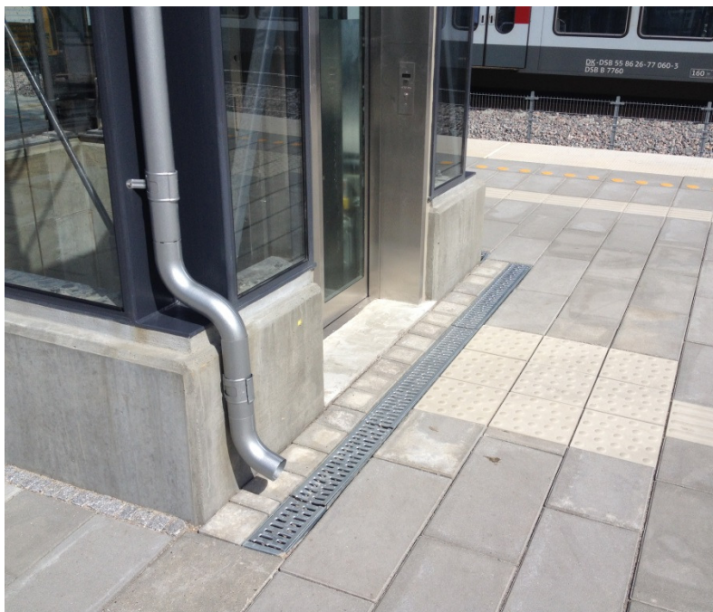
Liniedræn type ACO DRAIN® Multiline V100S, monteret med Spalterist i galvaniseret stål