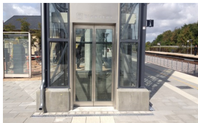
Der er monteret ACO DRAIN® Multiline V100S foran perron-elevatoren