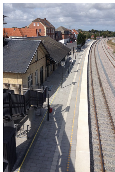
Det er nu installeret ACO DRAIN® V100S i perroner på Tølløse station