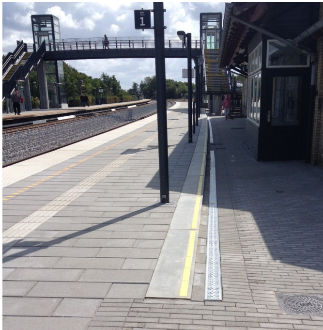
ACO DRAIN® V100S monteret i perron foran stationsbygningen