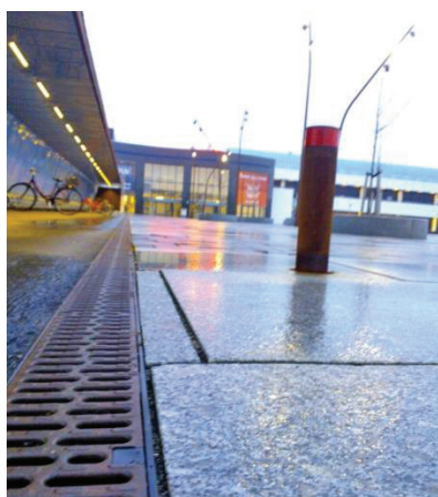
Multiline V100PP installeret ved granit-belægning på nordsiden af City2.