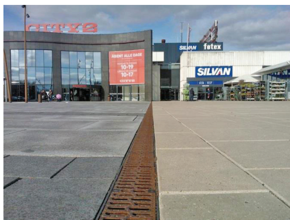
Multiline V100PP installeret ved granitbelægning på sydsiden af City2.