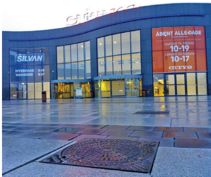
ACO brøndgods er installeret flere steder rundt om City2, her vist ved nordlig indgang.