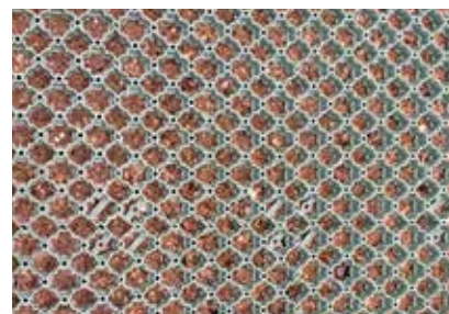
Græsarmeringen inden påfyldning af grus.