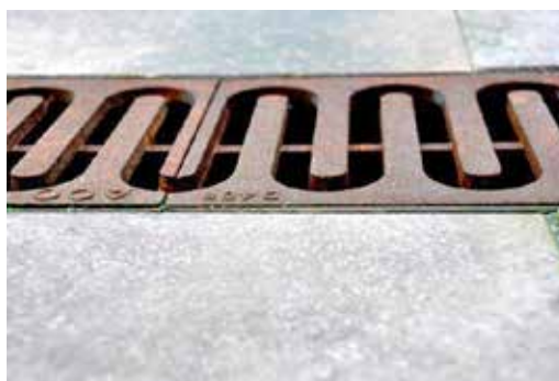
Liniedræn type ACO DRAIN Multiline V150G , monteret med designrist type "Løbende hund" i støbejern.