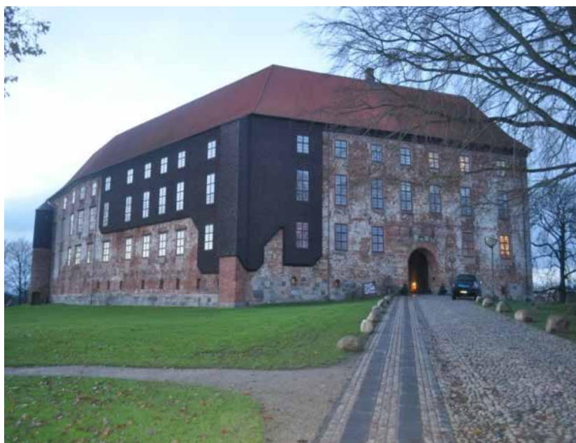
Restaureringen af Koldinghus er tildelt EUROPA NOSTRA-prisen