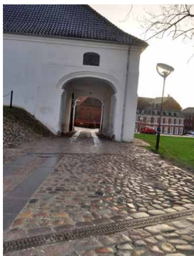
ACO DRAIN S100K monteret ved indkørsel til Slotspladsen.