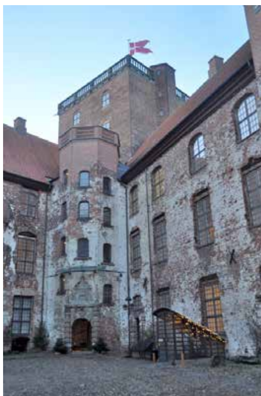
Der er monteret ACO DRAIN Multiline V150G øverst i det 35 meter høje udsigtstårn.